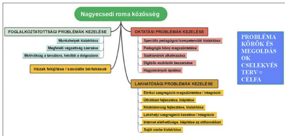
5. ábra – Eszköz-célfa – cselekvési terv – ötödik feladat

Végezetül pedig egy eszköz-célfa segítségével, a problématerképben bemutatott elemekkel összhangban kellett megjeleníteniük a „Szociálisan hátrányos helyzet és kezelése” című kurzus esetében egy cselekvési tervet.