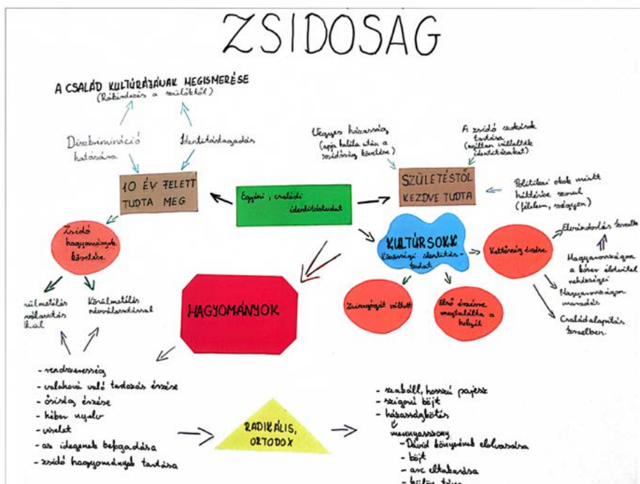
7. ábra - Identitástérkép - Córesz