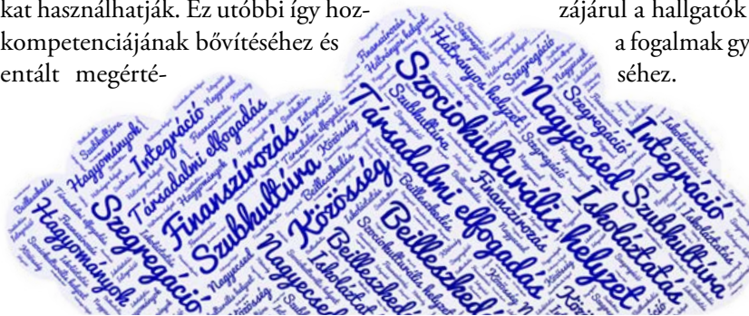
4. ábra - Szófelhő – negyedik feladat

A következő ábra egy szófelhőt mutat. Itt azt a feladatot kapták a hallgatók, hogy szedjék össze azokat a kulcsszavakat, amelyek elsősorban eszükbe jutnak a közösség szociális élethelyzetének javításának vonatkozásában. Ez a gyakorlat interaktív feladatként is megvalósítható postit-re felírt kulcsfogalmakkal, amelyeket egy táblára felragasztanak a hallgatók, és azt elrendezve, pontosítva összeállítható egy cselekvési terv. Fontos kiemelni, hogy elsősorban a szakirodalomban alkalmazott kifejezéseket, kulcsfogalmakat használhatják. Ez utóbbi így hozzájárul a hallgatók szaknyelvi kompetenciájának bővítéséhez és a fogalmak gyakorlati megértéséhez.